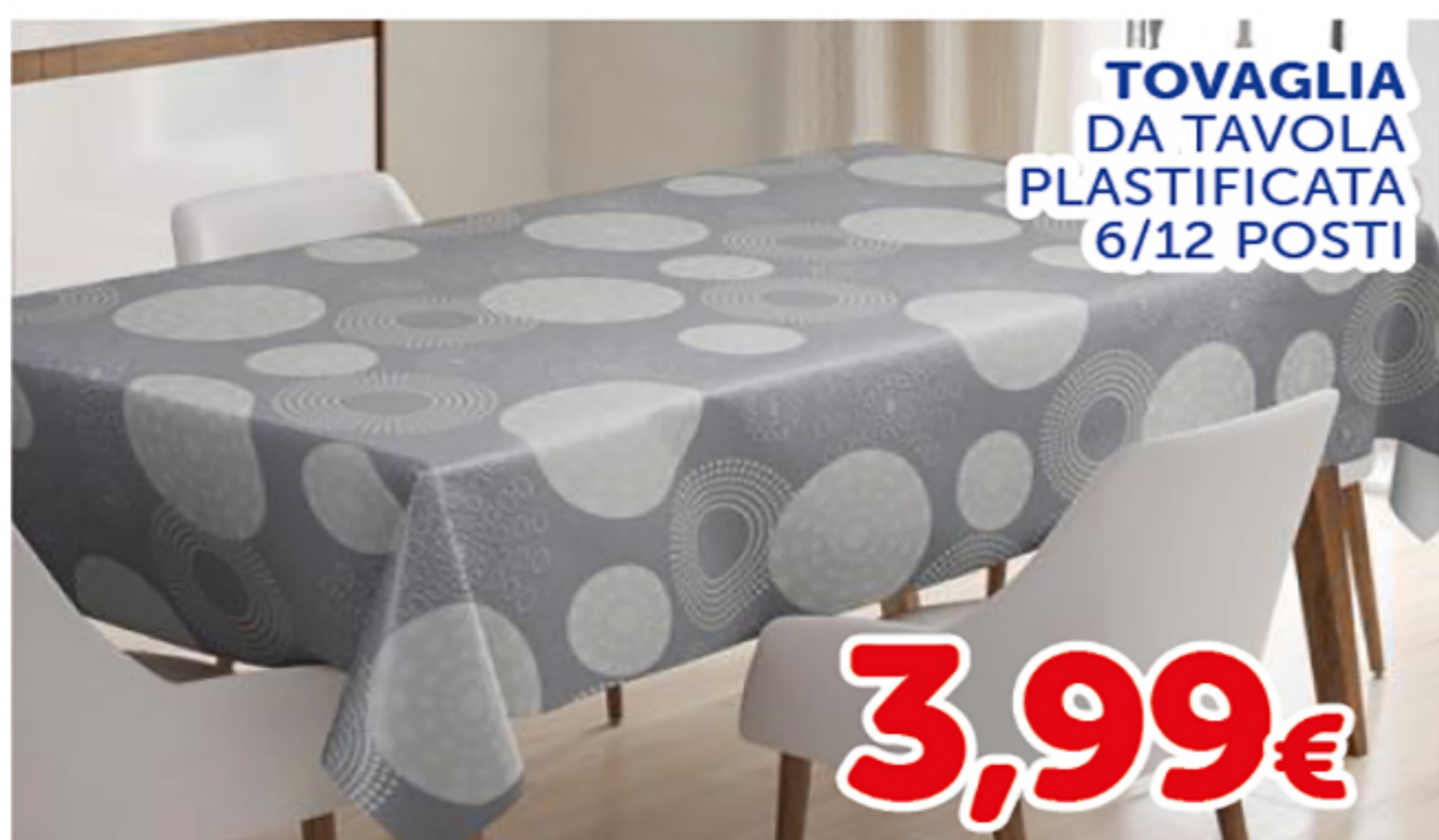
TOVAGLIA DA TAVOLA PLASTIFICATA 6/12 POSTI