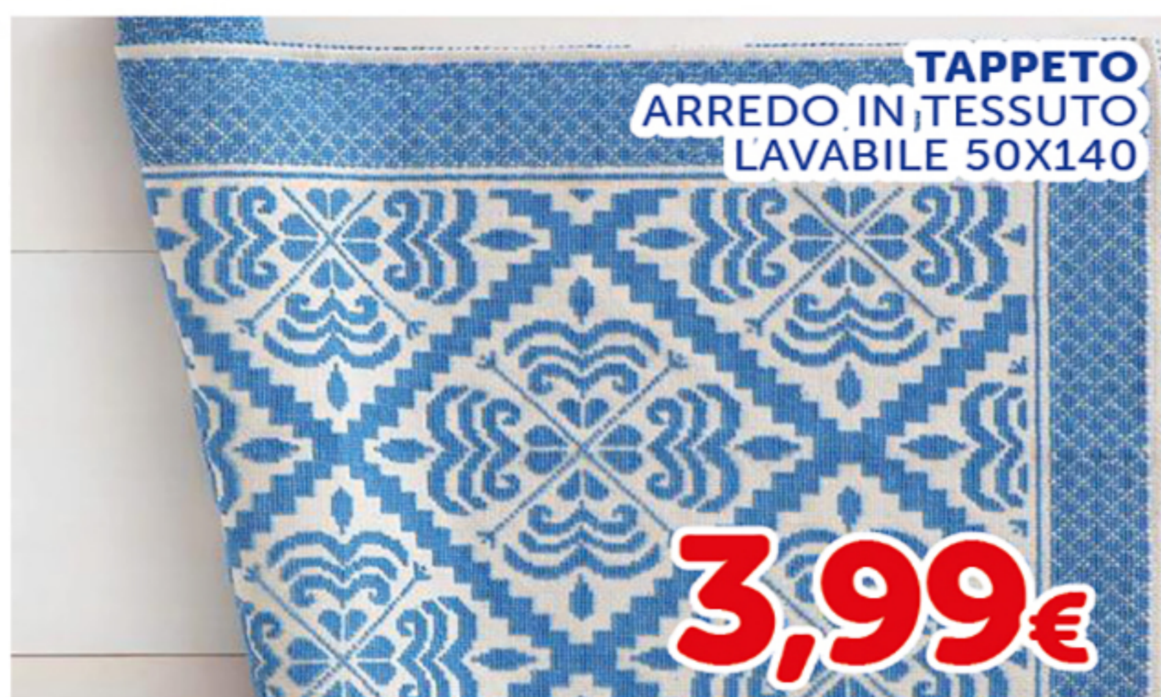
TAPPETO ARREDO IN TESSUTO LAVABILE 50X140