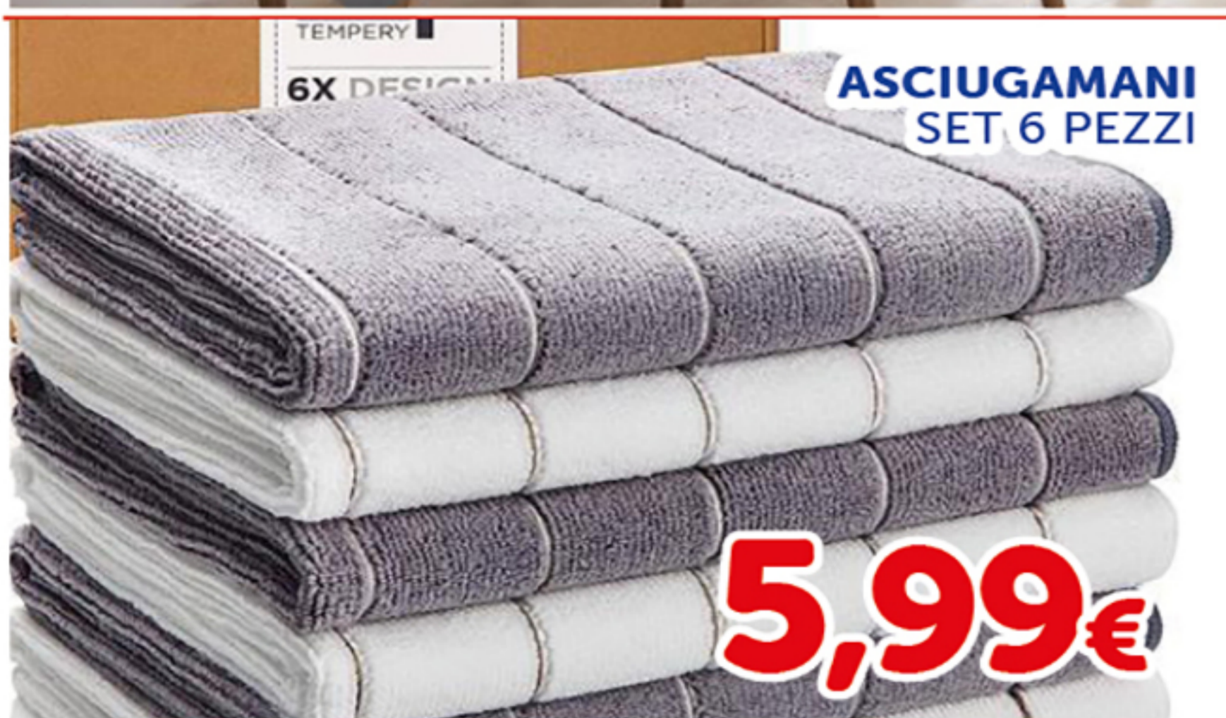
ASCIUGAMANI SET 6 PEZZI