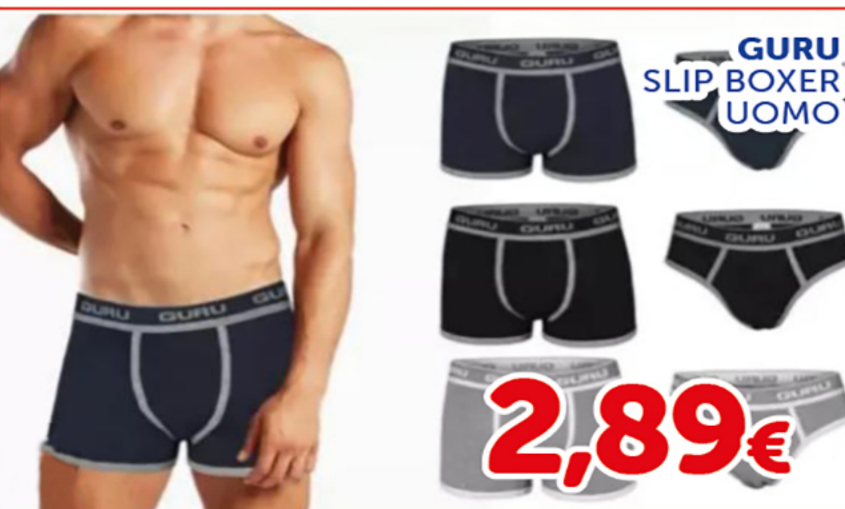
GURU SLIP BOXER UOMO