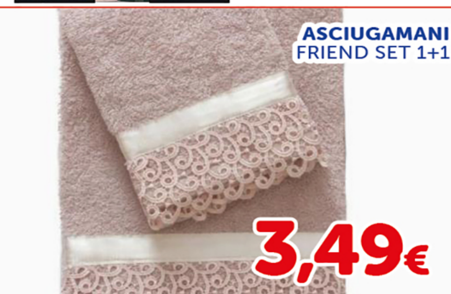
ASCIUGAMANI FRIEND SET 1+1